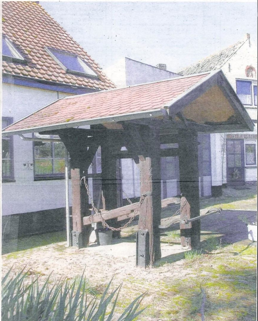
De oudste travalje van Zeeland staat al bijna 270 jaar in de West-Zeeuws-Vlaamse buurtschap Sasput.